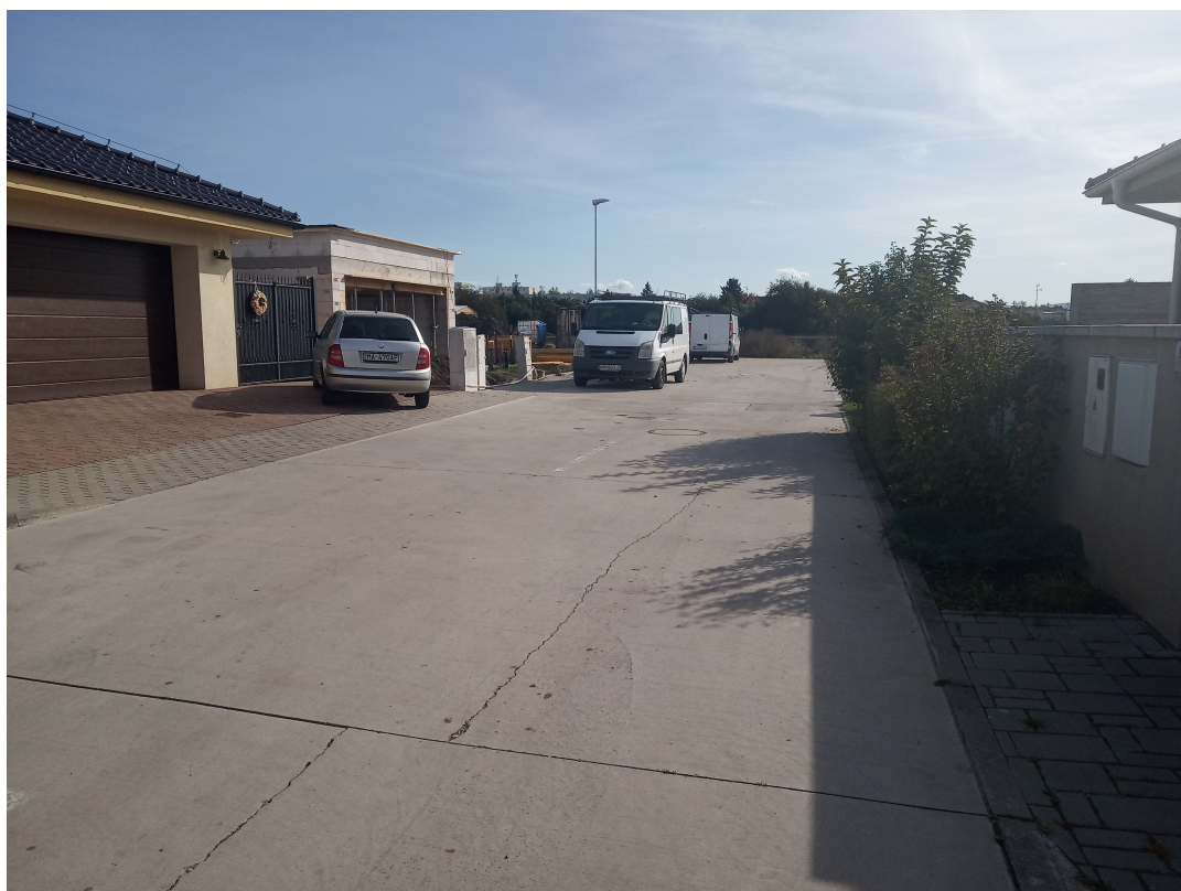
Ul. Ivana Dérera – predĺženie: