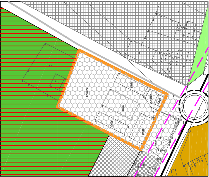
9 PŮVODNÁ FUNKCIA